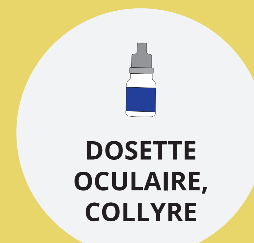
DOSETTE OCULAIRE, COLLYRE