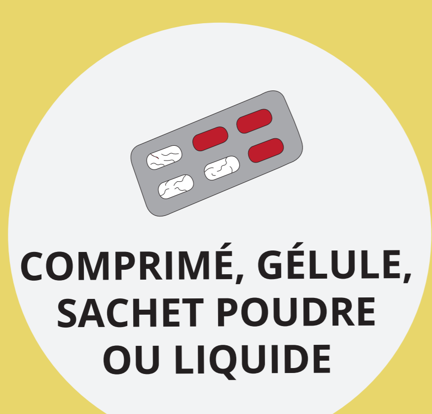
COMPRIMÉ, GÉLULE, SACHET POUVRE OU LIQUIDE