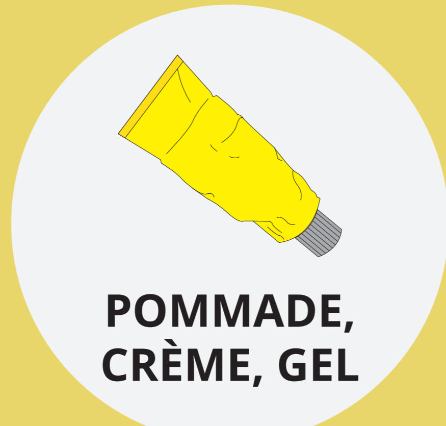
POMMADE, CRÈME, GEL