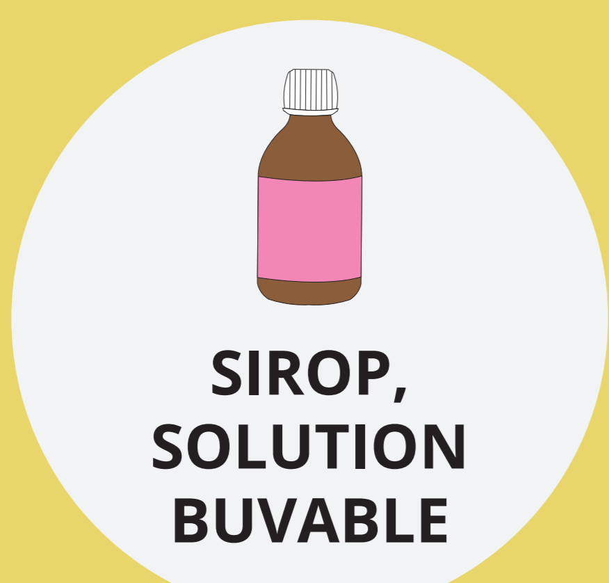
SIROP, SOLUTION BUVABLE