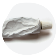
POMMADES, CRÈMES ET GELS...