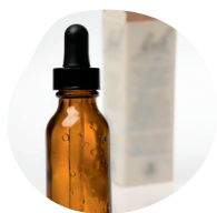
COLLYRES ET SOLUTIONS NON BUVABLES