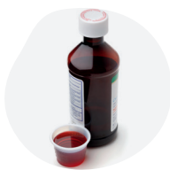
SIROPS ET SOLUTIONS BUVABLES