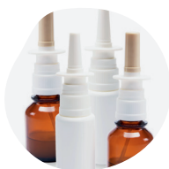
AÉROSOLS ET SPRAYS