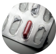
COMPRIMÉS, GÉLULES, POUDRES...

La récupération des médicaments non utilisés à usage humain par les pharmaciens est une obligation légale depuis 2007.